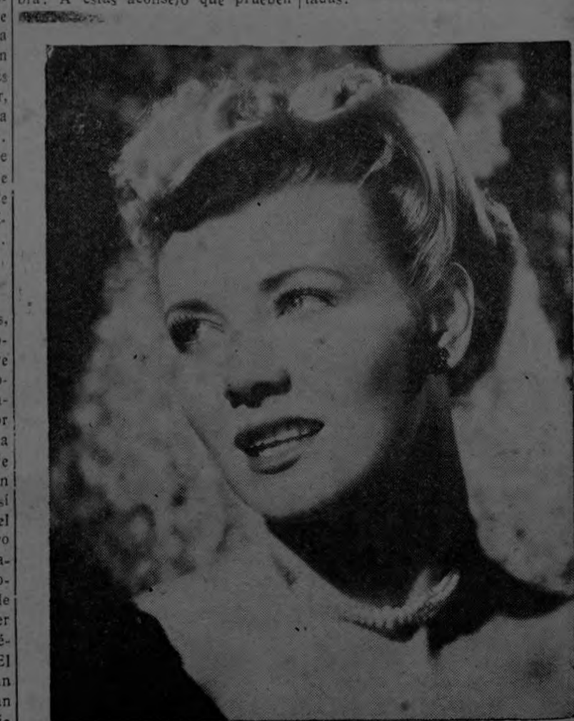
Un maquillaje perfecto, como el que siempre ostenta PENNY SINGLETON, la popular estrella de Hollywood Columbia, se obtiene estudiando

Es increíble el número tan crecido de mujeres que no saben aplicarse el creyón de labios como es debido. La mayoría, se aplican de demasiado de primera intención, y tienen que quitarse después lo que sobra. A estas aconsejo que prueben